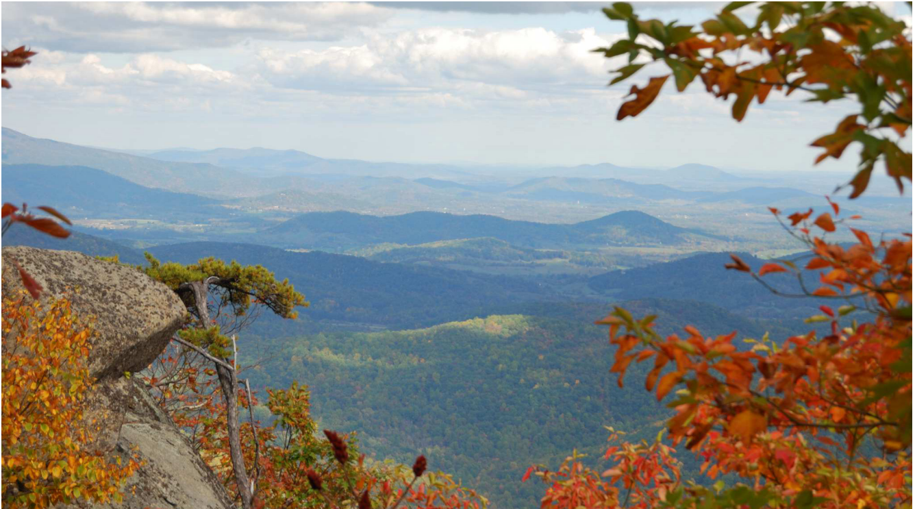
Figura 1. Wide Picture

purus elit, vestibulum ut, placerat ac, adipiscing vitae, felis. Curabitur dictum gravida mauris. Nam arcu libero, nonummy eget, consectetur id, vulputate a, magna. Donec vehicula augue eu neque. Pellentesque habitant morbi tristique senectus et netus et malesuada fames ac turpis egestas. Mauris ut leo. Cras viverra metus rhoncus sem. Nulla et lectus vestibulum urna fringilla ultrices. Phasellus eu tellus sit amet tortor gravida placerat. Integer sapien est, iaculis in, pretium quis, viverra ac, nunc. Praesent eget sem vel leo ultrices bibendum. Aenean faucibus. Morbi dolor nulla, malesuada eu, pulvinar at, mollis ac, nulla. Curabitur auctor semper nulla. Donec varius orci eget risus. Duis nibh mi, congue eu, accumsan eleifend, sagittis quis, diam. Duis eget orci sit amet orci dignissim rutrum.